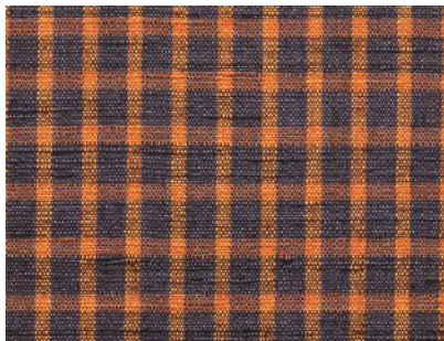
絹格子着尺(部分) 平成8年日本民藝館賞 群馬・伊田郁子 大阪日本民芸館蔵