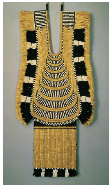
荷背負蓑 昭和46年日本民藝館賞 山形 日本民藝館蔵