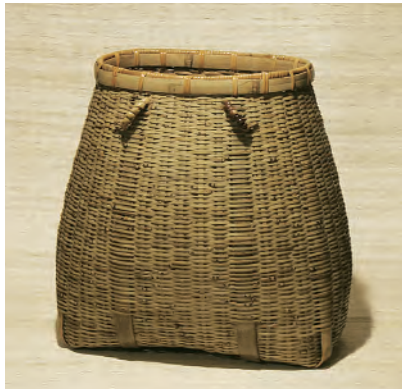
竹籠(きのこ入れ) 昭和46年入選 日本民藝館蔵