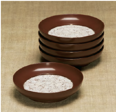
卵殻張銘々皿 平成18年日本民藝協会賞 岩手・光原社工房