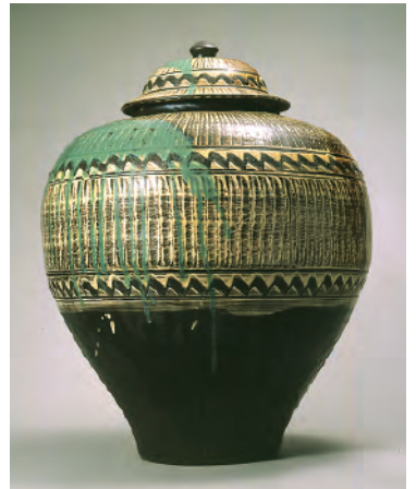
刷毛目打掛蓋付大壺 昭和62年入選 大分・小鹿田 大阪日本民芸館蔵