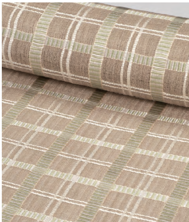
— 2023年度日本民藝館賞受賞作 — 吉野格子帯地 齊藤佳代子（東京都）